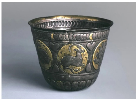
Рис. 1. Урсдонский кубок (Государственный Эрмитаж, инв. № КЗ-5322).